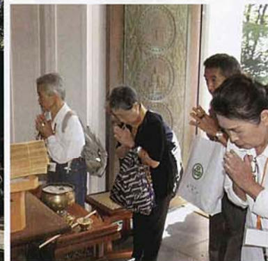
職衆の山伏・僧侶と共に御信徒の皆様が一心に祈りを捧げる