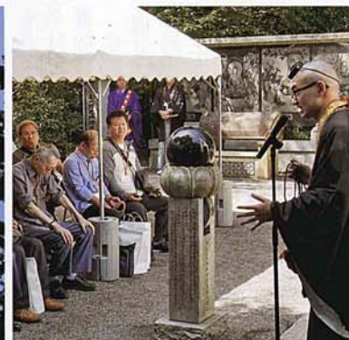
法要に先立ち法話が行われる