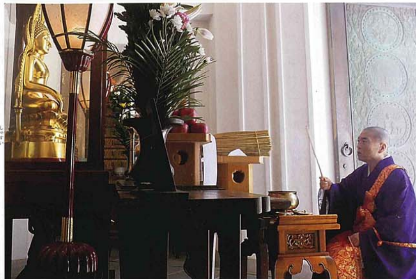
菅谷執事長により洒水加持が行われる