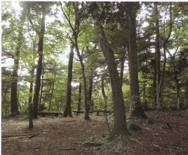
炊谷園地 中興開山ゆかりの地名が残る

心門へ至るルートである。前ノ沢方面へ少し降りる途中に「炊谷園地」がある。近年付近の整備がされたようで意外な場所に開豁地としてあり、疲れた足を休める格好の場所となつている。