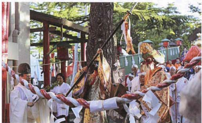
小御嶽神社開山祭「道開きの神事」

われた後、「人形」に穢れを移し、これが集められる。その後拝殿前にしつらえられた「茅の輪」をくぐる「茅の輪くぐり」の行事が行われ、昇殿する。昇殿後は「宮司一拝」「献饌」「宮司祝詞奏上」「宮司玉串拝礼」「参列者玉串拝礼」「宮司一拝」で「開山前夜祭」が行われ、