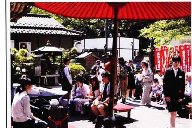
の だて 裏千家淡交会第八西支部の皆様による野点茶会