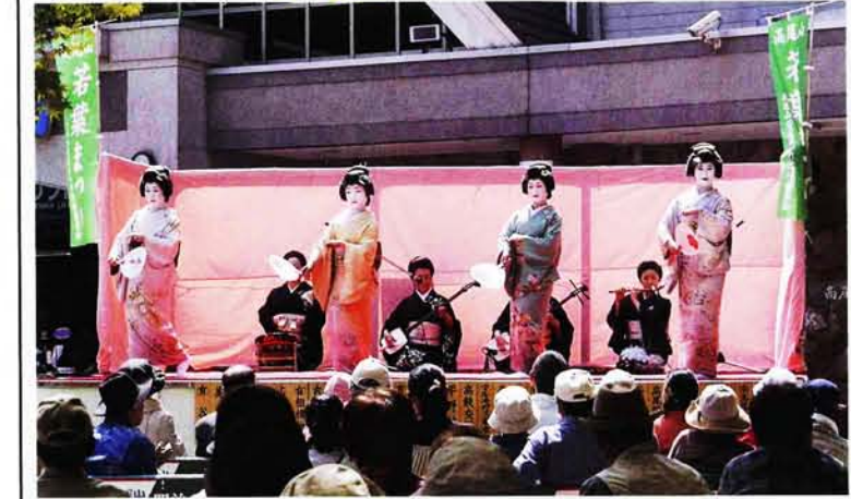
八王子芸妓組合による華やかな祝いの舞