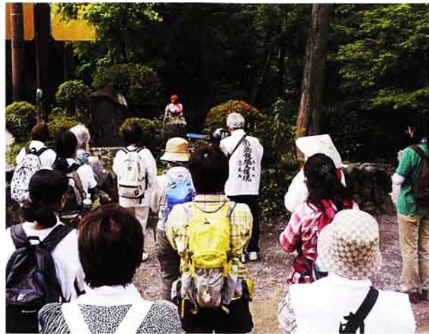
山内各所のお大師様をお参りする