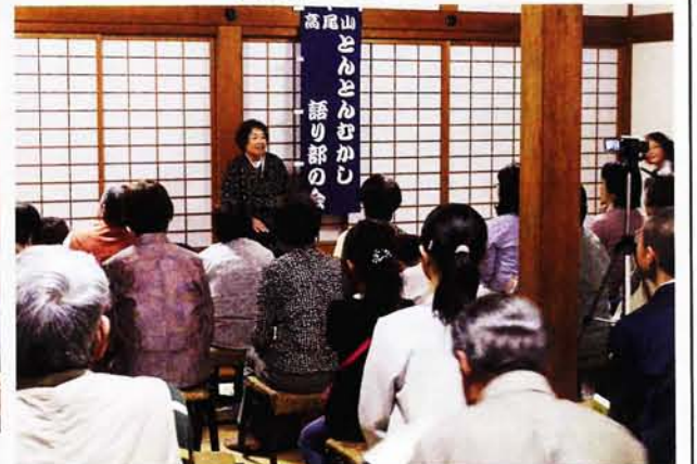
語り部の会による「とんとん昔」