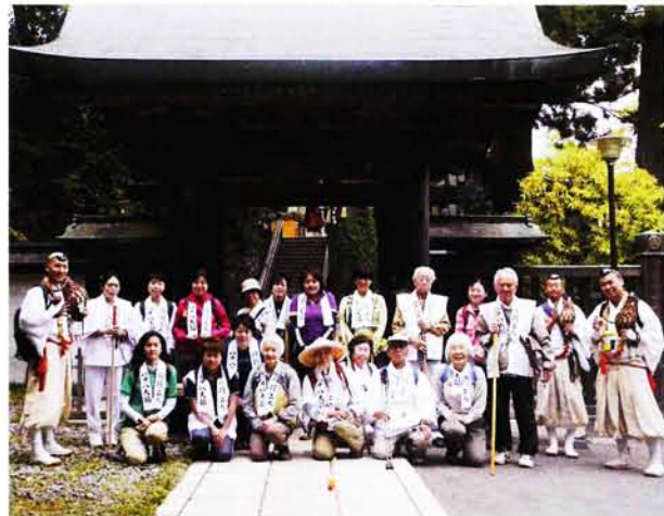
先達の山伏と共に記念撮影

去る五月十二日、高尾山内八十八大師巡りが行われ、総勢十八名の方々が参加された。清滝周辺のお大師様から始まり、琵琶滝方面へ進み、険しい坂道の道中を山上まで徒歩練行し、道中のお大師様に法衆をあげた。