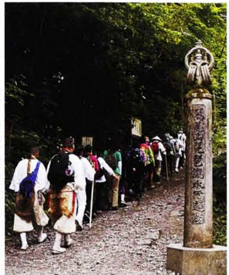
琵琶滝を通り山中へ分け入る

去る五月十二日、高尾山内八十八大師巡りが行われ、総勢十八名の方々が参加された。清滝周辺のお大師様から始まり、琵琶滝方面へ進み、険しい坂道の道中を山上まで徒歩練行し、道中のお大師様に法衆をあげた。