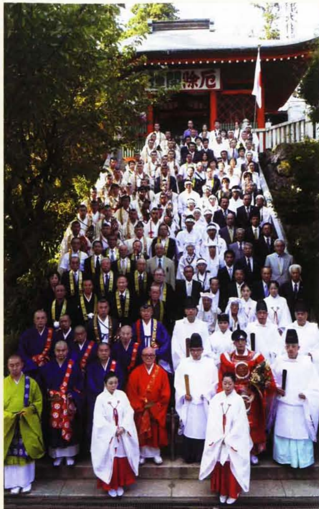
100人以上の参列者がそらい祈りを捧げた