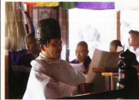
北口本宮富士浅間神社上文司宮司による祝詞奏上