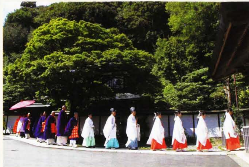
日本古来の神仏合同の法要が高尾山で営まれた