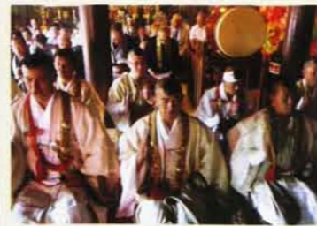
高尾山修験道の山伏も参列