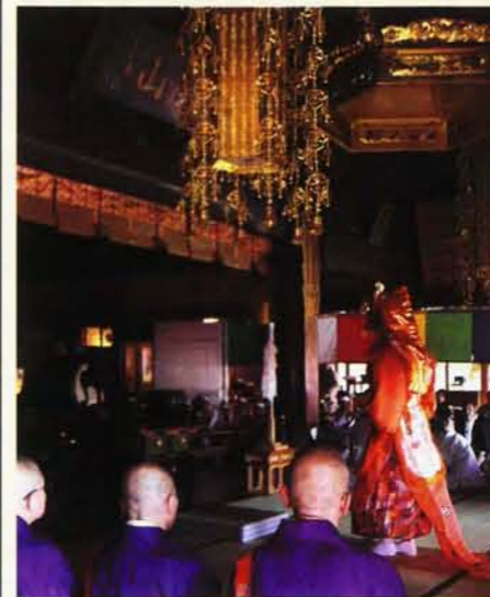
蘭陵王の舞が大本堂にて奉納される