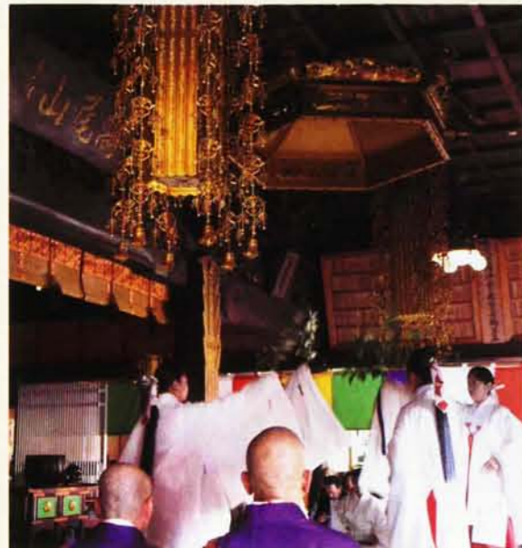
巫女による豊栄舞