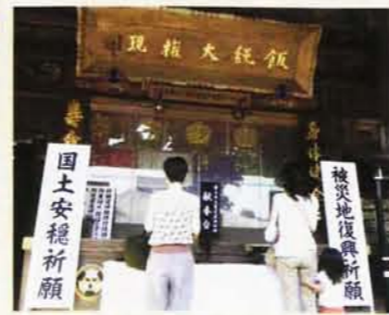
大本堂の前で祈る参詣者