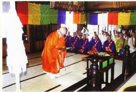
大山貫首の玉串拝礼