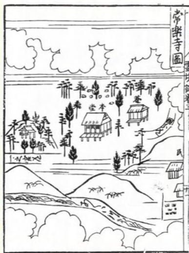
内閣文庫本「四国偏礼霊場記」(元禄二年版)

法したので、大師は霊木を選び弥勒菩薩を彫り、堂宇を建てて本尊にしたと伝えられます。それにより御詠歌は「常楽の岸にはいつか知らまし弘誓の船に乗りおくれずば」と詠まれます。